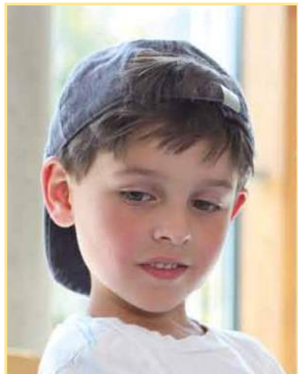
Abb.: Ministerium für Gesundheit, Soziales, Frauen und Familie, Düsseldorf 2005, S. 17.

Mit Blick auf den Entstehungsprozess von Misshandlung und Vernachlässigung wird oft festgestellt, dass frühzeitig Anzeichen diesbezüglich wahrgenommen werden. Entweder werden diese aber gar nicht im Sinne einer Gefährdungseinschätzung bewertet, um daraus Schlüsse für das im Einzelfall angezeigte Schutzkonzept zu ziehen (Beteiligung der Eltern, Meldung an das Jugendamt, Inobhutnahme, Einschaltung des Familiengerichts, Einschaltung der Polizei usw.) oder sie werden zu uneindeutig weitergegeben. Erst eine klare Wahrnehmung und eine eindeutige Warnung an die verantwortlichen Akteure und Institutionen können konsequentes Handeln zum Schutz von Kindern nach sich ziehen. 7